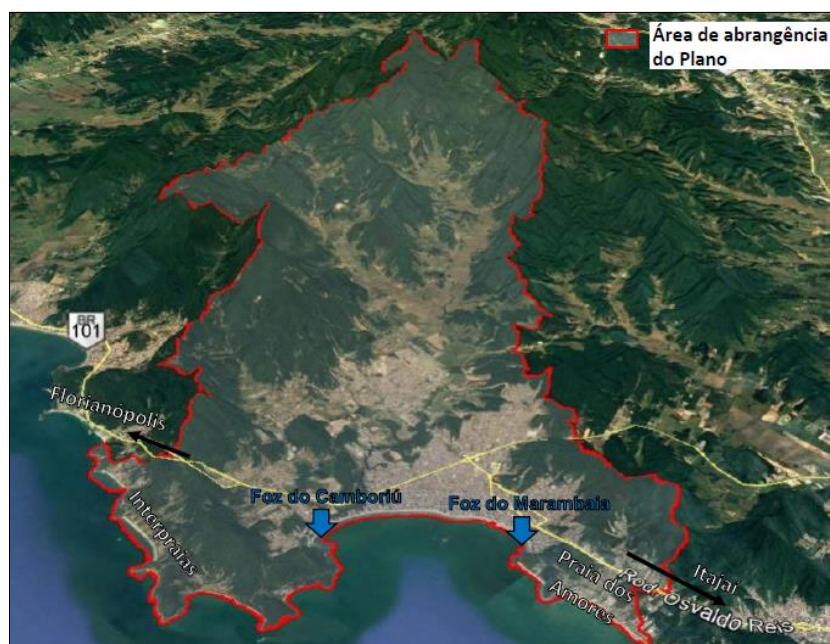
Figura 1. Área de abrangência do Comitê Camboriú (perímetro em vermelho), contemplando os municípios de Camboriú e Balneário Camboriú.

A área de atuação do Comitê abrange a Região Hidrográfica do Vale do Itajaí 07, formada pela Unidade de Planejamento e Gestão dos Recursos Hídricos UPG 7.2 - Camboriú, conforme disposto na Divisão Hidrográfica Estadual (Resolução CERH nº 26/2018), compreendendo a Bacia Hidrográfica do Rio Camboriú e pelas demais bacias hidrográficas com exutórios no Oceano Atlântico localizados entre as seguintes coordenadas: 738740 E, 7004515 N e 735505 E, 7017973 N no Sistema de Projeção UTM, Fuso 22 Sul, Sistema de Referência SIRGAS 2000. A Bacia Hidrográfica do Rio Camboriú abrange dois municípios, i.e Camboriú e Balneário Camboriú (Figura 1).